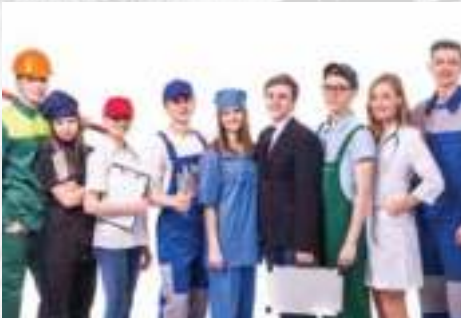
الزبي الموحد للقطاعات الصناعية INDUSTRIAL UNIFORMS