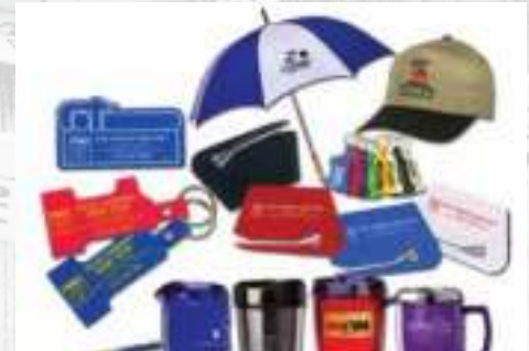
الهدايا والمنتجات التذكارية GIFTS & SOUVENIR ITEMS