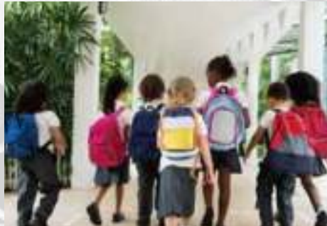
الزبي المدرسي SCHOOL UNIFORMS