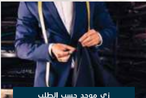
زبي مودد حسب الطلب CUSTOM MADE UNIFORMS