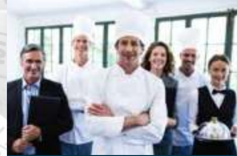
الزبي الرسمي للضيافة HOSPITALITY UNIFORMS