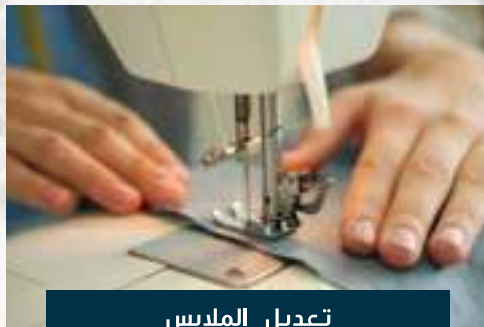
تعديل الملابس GARMENT ALTERATIONS