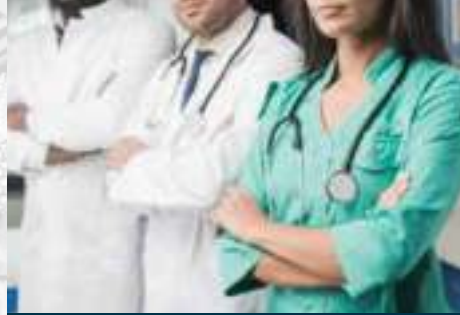
زبي الأنظم الطبية والمنتجات الصحية MEDICAL & SPA UNIFORMS