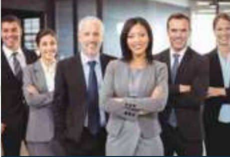
ملابس وإكسسوارات الشركات CORPORATE GARMENTS & ACCESSORIES